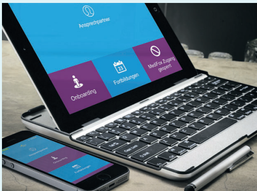
Ein mobiles Intranet schafft Teilhabe und verstärkt die Mitarbeiterbindung.