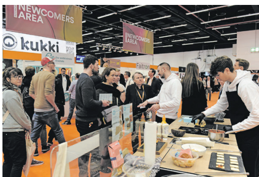
Die INTERNORGA erfreut sich regen Zuspruchs.

Im Frühjahr 2024 begrüßt Hamburg wieder die ganze Branche: Vom 08. bis 12. März 2024 findet die INTERNORGA, die internationale Leitmesse für Hotellerie, Gastronomie, Bäckereien und Konditoreien, statt. Bereits jetzt dürfen Besucher auf spannende Themen auf der INTERNORGA Open Stage, außergewöhnliches Networking in der Afterwork-Lounge OFF THE RECORD, viele neue und alte Key-Player sowie Innovationen aus allen Branchen gespannt sein.